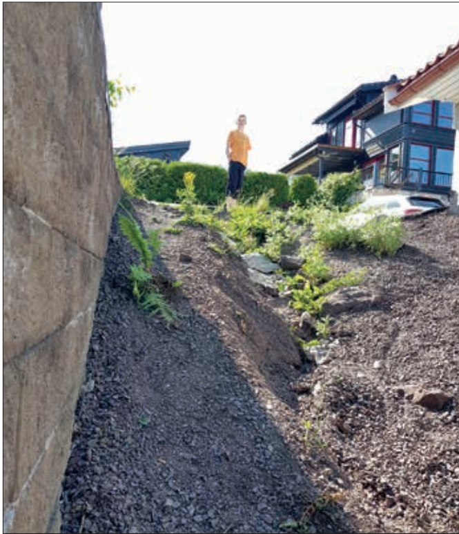
Den gamle trappa opp til Hans Heyerdahls vei er revet. Ny grov, erosjonssikker pukk skal legges ut i skråningen og ny trapp skal etableres.