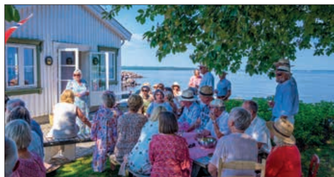
Feiring fra morgen til kveld.

Etter alle opplevelsene gjorde det godt med nachspiel og nattmat i Badehuset.