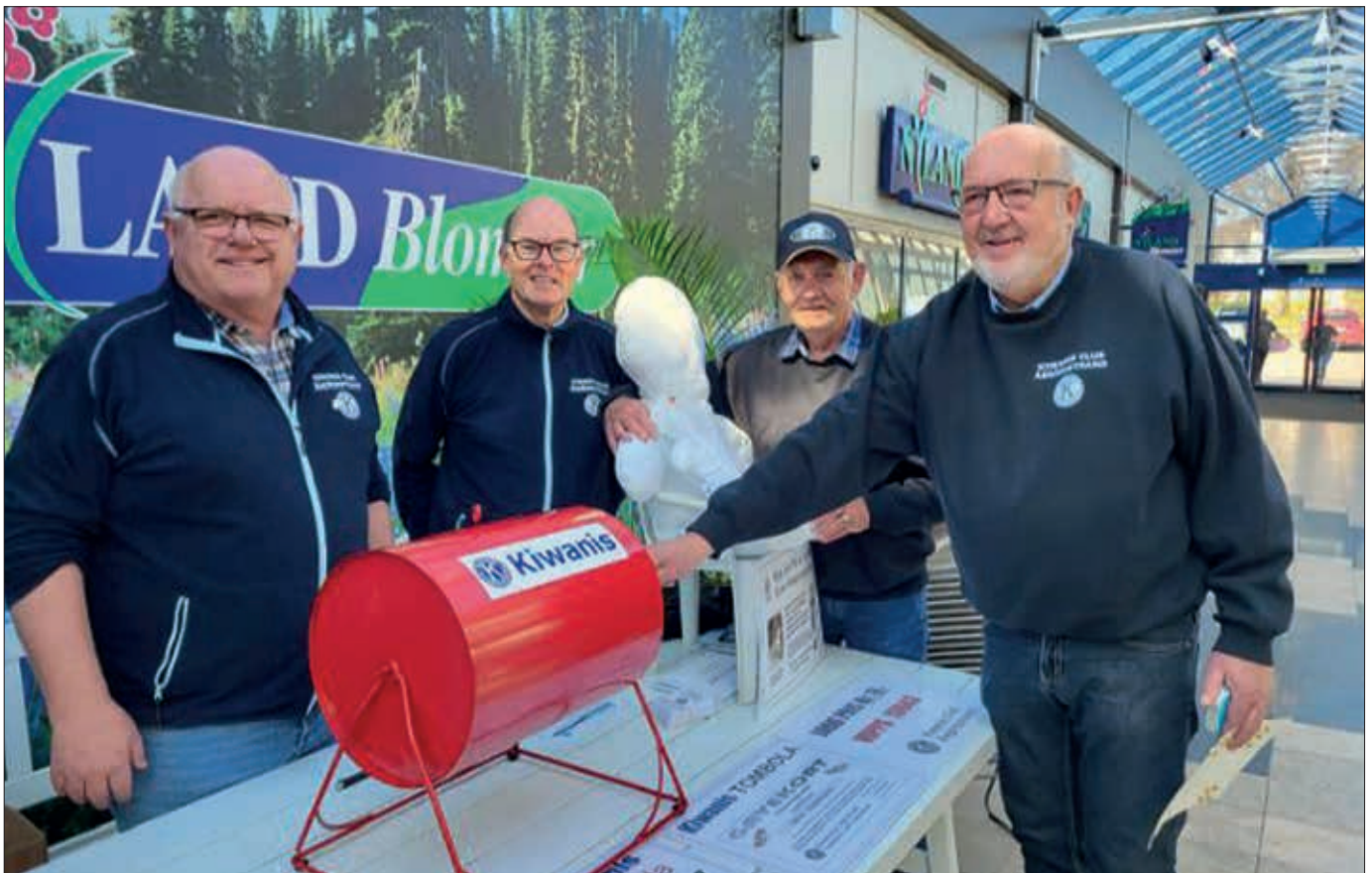
Dukkedag og dukketombola på Paletten

På mange måter kan Åsgårdstrand være blant modellene når boken om Kardemomme by ble til. De som er oppvokst i 50- og 60-årene husker sikkert den gode stemningen når Thorbjørn Egner leste fra boken i barnetimen for de minste.