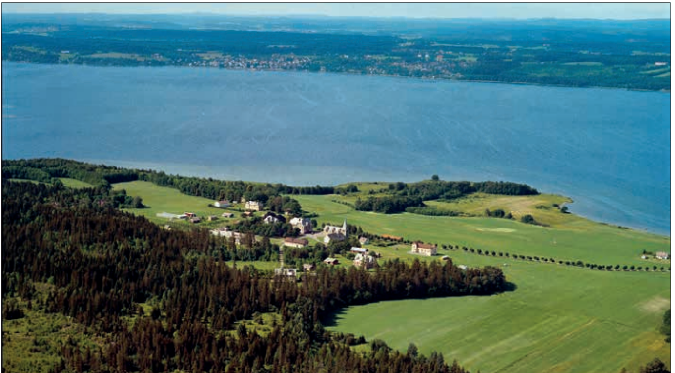
Foto: Bastøy med Åsgårdstrand i bakgrunnen.

Bastøy, ei verdenskjent og myteomspunnet øy, ei perle i vår kommune, midt i Oslofjorden og lett synlig fra Åsgårdstrand.