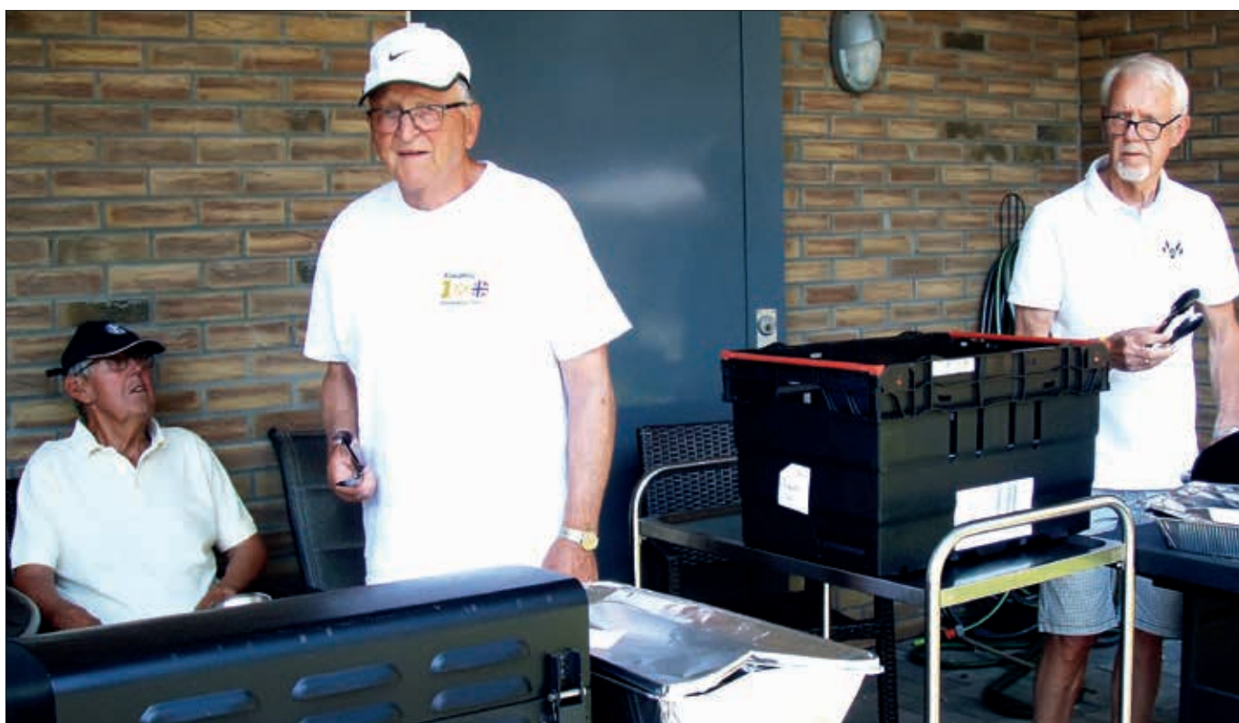
Vi griller på Åsgårdstrand sykehjem

Kiwanis ønsker alle fortsatt en riktig god sommer!