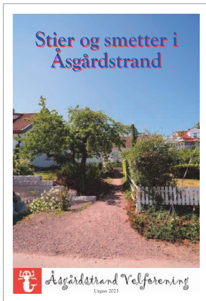
Ny utgave av Stier og smetter i Åsgårdstrand kommer i høst.

Parallelt med søknad om nytt heftet sendte Rune også søknad til kommunens tilskuddsordning «grønne midler»