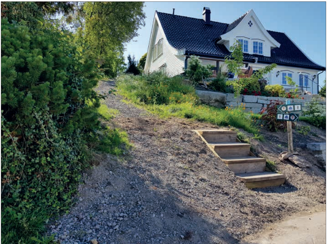
Den nye trappa opp til Bakkeåsen.

Åsgårdstrand Velforeningen søker om tilskudd både fra kommunen, sparebankstiftelser og andre relevante givere til konkrete prosjekter, men vår største inntekt og ressurs er fortsatt medlemskontingenten og dugnadsinnsatsen. Det er de to faktorene som gjør at slike prosjekter kan realiseres. Tusen takk til alle som har støttet oss så langt på den ene eller andre måten - eller på begge måter - og vi håper dere fortsatt vil gjøre det! Nye medlemmer i form av betalte kontingenter og deltagere i en av komiteene er alltid velkomne!