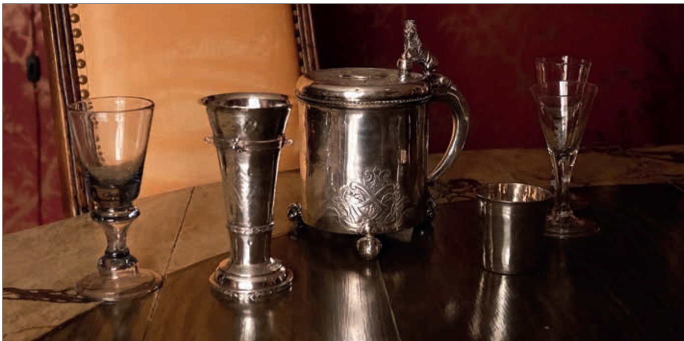
Drikkekanner i sølv.

Det å drikke har alltid vært forbundet med strenge ritualer og tradisjoner. Heldigvis er ritualene litt mer avslappet i våre dager.