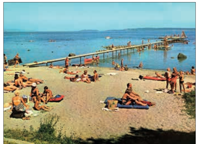
Fra stranda i 1967.