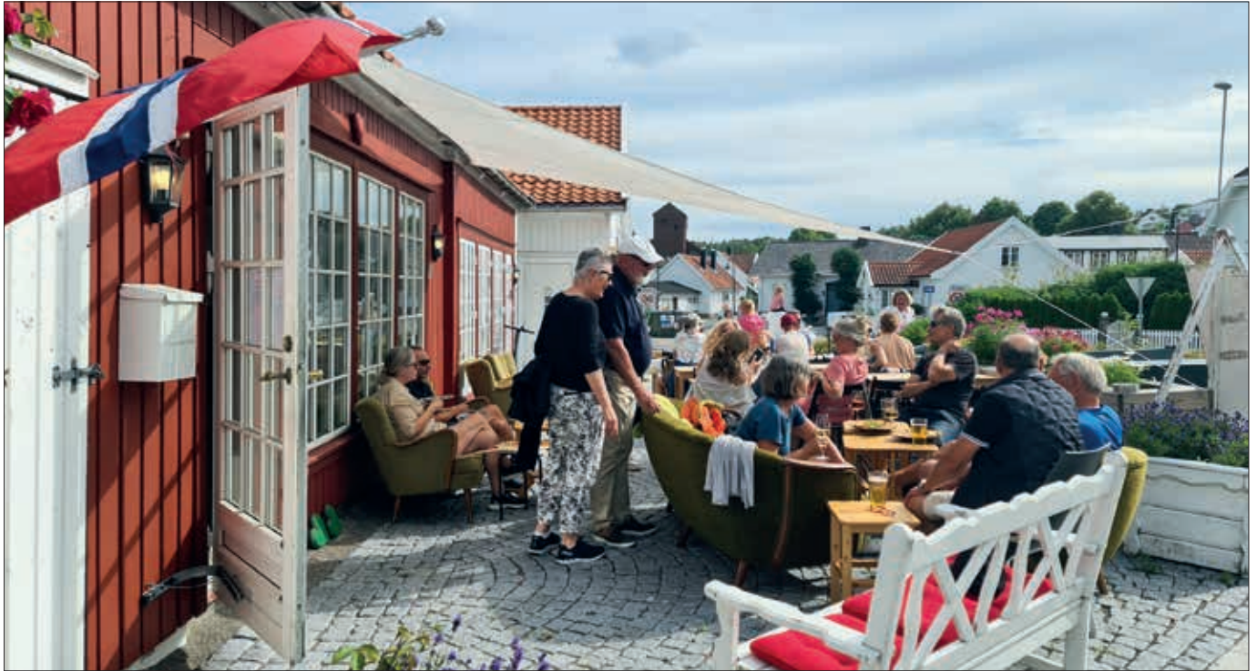
Fredagsstemning på Torvet. Hele året! Ute eller inne.