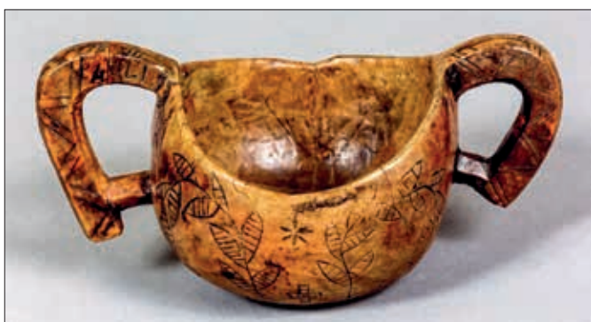
Drikkekar av dreid/uthulet treverk.

Hos oss i Norge var drikkeutstyret viktig. Det du drakk av viste og markerte vertsfamiliens stand og rang. Bøndene brukte oftest ulike drikkekar av dreid/uthulet treverk. Gjerne flott malt med dekor av roser, blomster, figurer og ulike symboler. Til hverdags ble det brukt enkle drikkekar, og til store fester kom familiens praktkar frem. Disse karene kunne være store og tunge, så derfor fantes det små kopper man drakk «Einskild» av. Mellomstore drikkekar