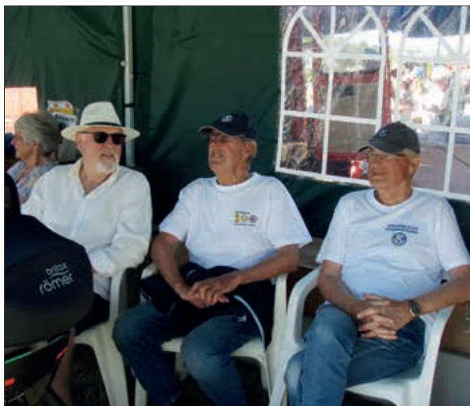
Gutta tar en pust i bakken Åsgårdstrandsdagene

ninger, Joker, Åsgårdstrand hotell, Munch kafé og restaurant, og våre kjære kunstnere og atelierer i Smalgangen. 10 flotte gevinster er trukket og gevinstene er levert til vinnerne. Vi fikk inn gode inntekter, som selvsagt går direkte til våre gode formål. Vi har til nå delt ut kr 301.387,-